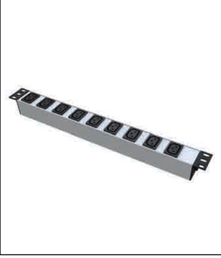
PDU - 19" 1U IEC320 C13 prizli

Anodize alüminyum profil gövde 16 A, 250 V AC (50-60 Hz) 3500 W maksimum güç IEC320 C13 prizli 2 mt. UPS fişli kablolu (3 x 1,5 mm 2 ) IP 20