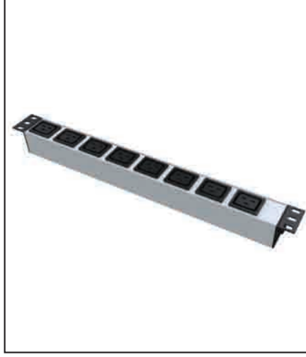
PDU - 19" 1U IEC320 C19 prizli

Anodize alüminyum profil gövde 16 A, 250 V AC (50-60 Hz) 3500 W maksimum güç IEC320 C19 prizli 2 mt. UPS fişli kablolu (3 x 1,5 mm 2 ) IP 20